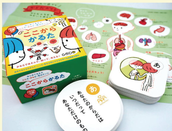
※5歳から学べる性教育教材「ここからかるた」

最近では、包括的性教育を遊びながら学べるかるた教材「ここからかるた」を活用して、小学生や障害のある子ども・若者にもワークショップを実施することもあります。また、性教育の書籍も最近は豊富に出版されており、専門家が関わる性教育サイトも増えつつあります。このようなツールも利用しながら、 まずは大人も、性について向き合い学ぶこと、安心できる人と無理のない範囲で話してみるところから始めてみてはいかがでしょうか。