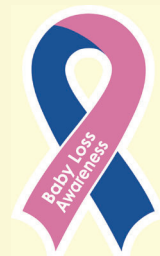
ピンク&ブルーリボン

最終日15日午後7～8時は、亡き赤ちゃんのご家族を想いキャンドルを灯す「Wave of Light」が世界中で開催されます。もし身近に当事者がいたら、キャンドルを灯した写真と共に、 気にかけていることを伝えるだけでも力になっていく と思います。 ピンク&ブルーリボンを通して、何ができるかを考えていただけたら嬉しく思います。