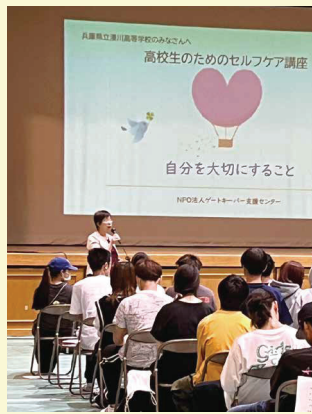
令和5年度 学校で取り組む自殺予防支援事業で兵庫県立湊川高校にて講演

自殺念慮がある方を支えていると、心に大きな負担がかかることがあります。そんなときは 自分が楽しむことやゆっくりすることを許し、自分の好きなことをする時間を作る ようにします。それでも辛くなったら、誰かに話を聴いてもらって下さい。 支えている人も支えてもらいましょう。